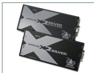
El extensor de KVM opcional permite colocar el monitor a una distancia de hasta 300 m del ordenador.