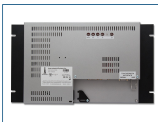
Vista trasera del monitor de montaje en bastidor de 15".