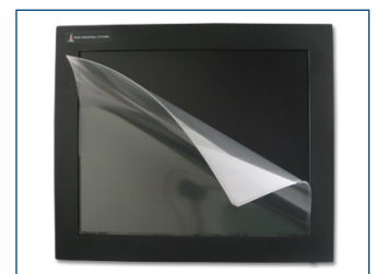
El protector de pantalla opcional protege las pantallas táctiles contra los arañazos y el desgaste.