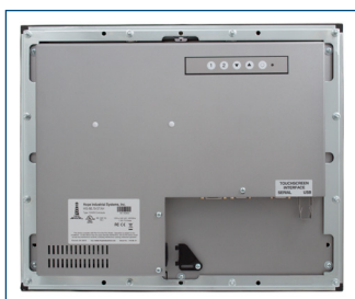
Vista trasera del monitor de montaje en panel de 19".