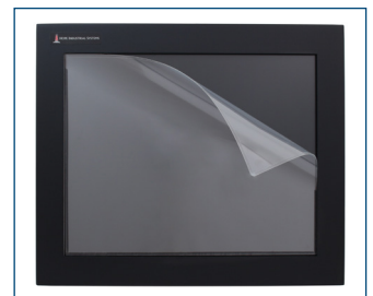
El protector de pantalla opcional protege las pantallas táctiles contra los arañazos y el desgaste.