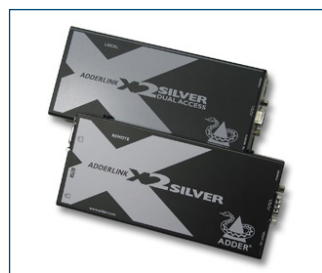
El extensor de KVM opcional permite colocar el monitor a una distancia de hasta 300 m del ordenador.