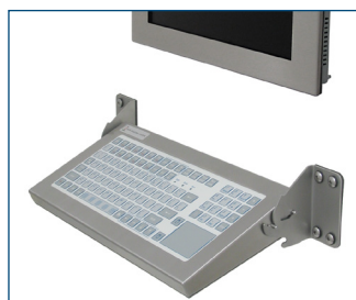
Configuración de estación de trabajo de montaje en panel con monitor y teclado industrial.