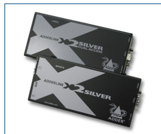
El extensor de KVM opcional permite colocar el monitor a una distancia de hasta 300 m del ordenador.