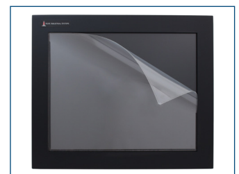
El protector de pantalla opcional protege las pantallas táctiles contra los arañazos y el desgaste.