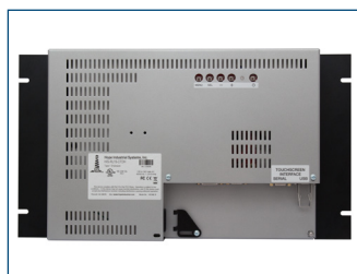
Vista trasera del monitor de montaje en bastidor de 15".