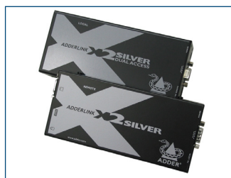
El extensor de KVM opcional permite colocar el monitor a una distancia de hasta 300 m del ordenador.